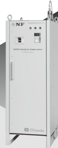
水電解による水素製造に 電解槽の仕様にあわせてカスタマイズ