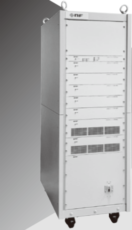
スケーラブル & フレキシブル 用途にあわせて自在にシステム構築